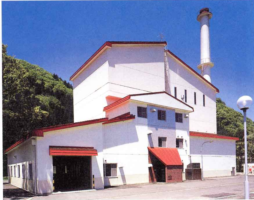
▲西部環境センター