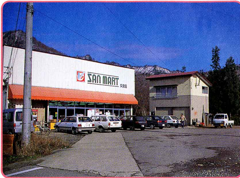
◀ 自動車で来る人のための広いちゅう車場