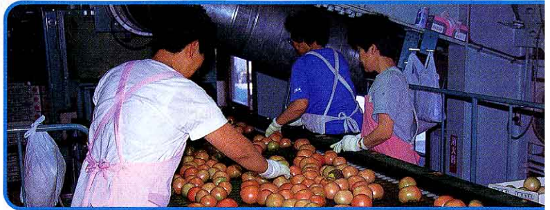
⑥ ベルトコンベアーで2階へあげられ、きずものをチェック。