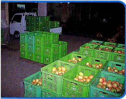
① 大倉のJA 集出荷場へ持って行く。