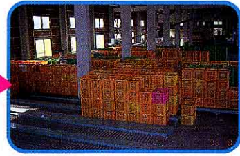
⑤ 只見、南郷、伊南、館岩からトマトがどっさり(1階)