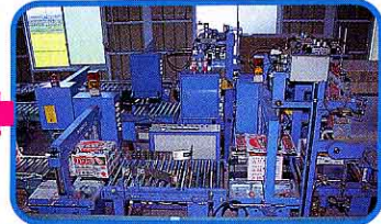
⑩ ふたをし、ひもをかける機械