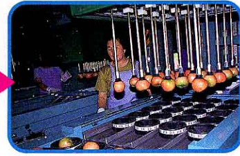
⑧ すいつけて持ち上げ、箱に入られる。