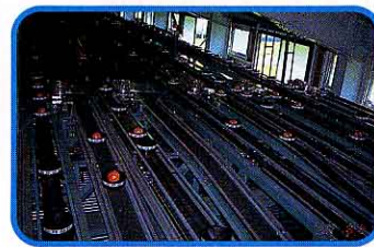
⑦ 大きさ・等級ごとにひとりでに分けられる。(選別)