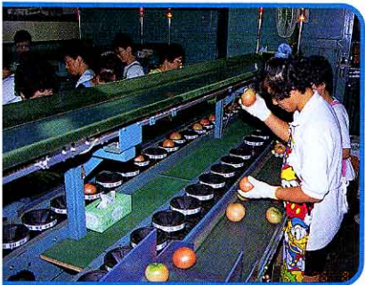
② バーコードのついた皿にのせると、コンピューターと光センサーで、大きさや色み(等級)がよみとられる。