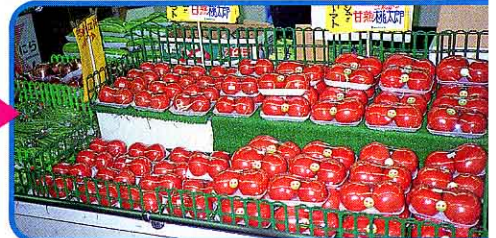
⑫ 次の日にはお店にならぶ。