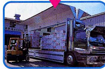
⑪ 大きなトラックで東京方面の市場へ。