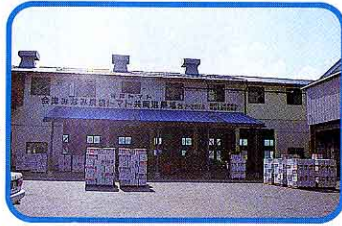
④ 南郷村宮床のトマト選果場へはこぼれる。