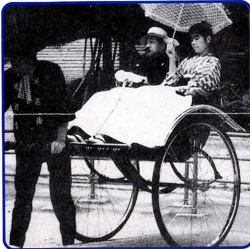
(約100年前 めいじ 明治)