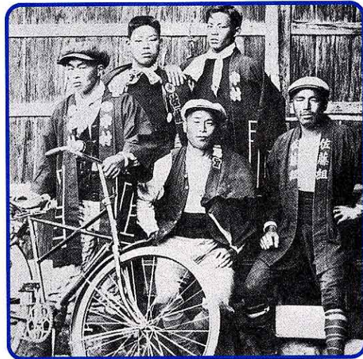
(約80年前 たいしょう 大正8年)