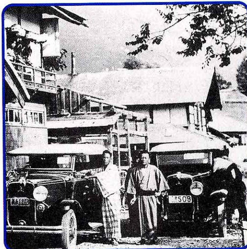
(約65年前 しょうわ 昭和5年)