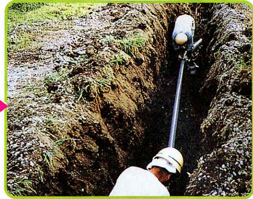
② 配水管をうめる工事