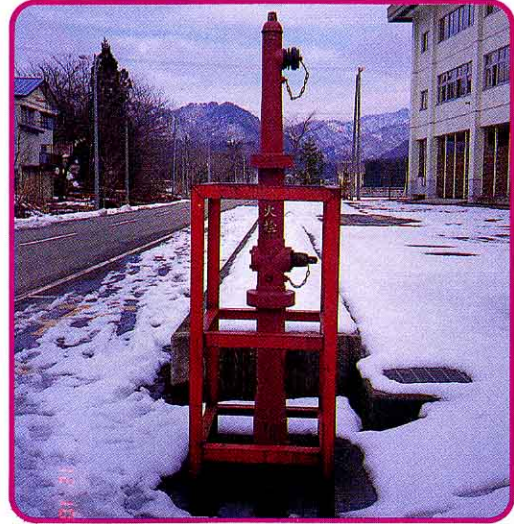
④ 消火栓 しょうか せん