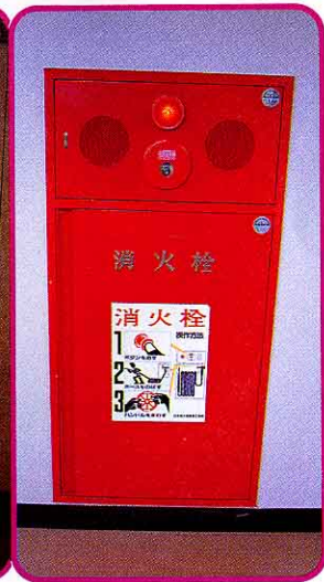
④ 消火栓 せん