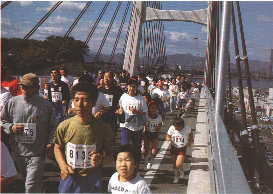
第1回松川浦大橋ふれあいマラソン