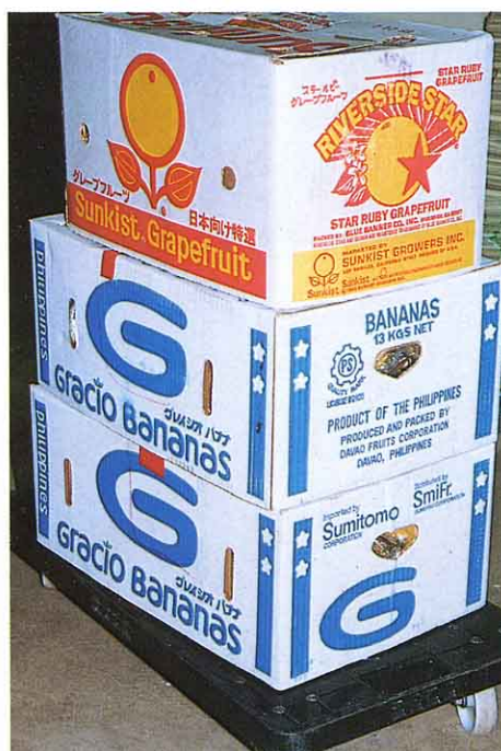
日本かく地から運ばれるしなもの 外国から運ばれるしなもの