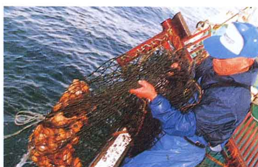
海で魚や貝をとる