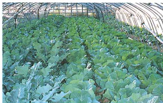
田・畑で作物をつくる