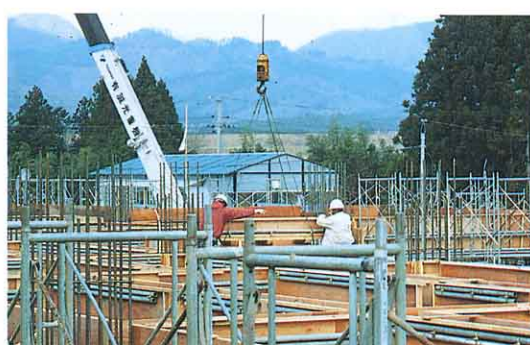
たてももの 建物をつくる