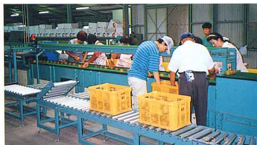
しゅうかく・しゅっか