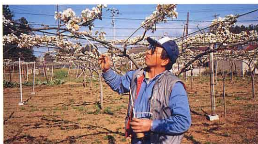
じゅふん なしをそだてるこよみ