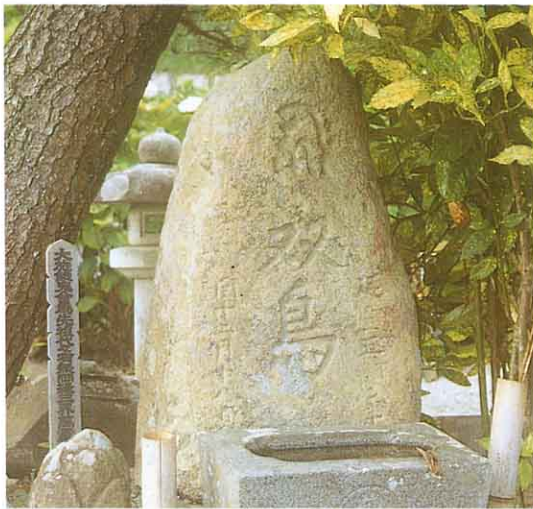
てんせつ おし鳥伝説 (桜丘小)