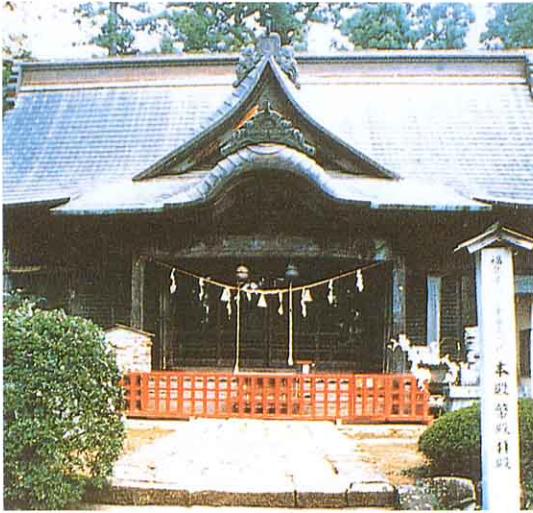
やわたじんじゃ 八幡神社 (八幡小)