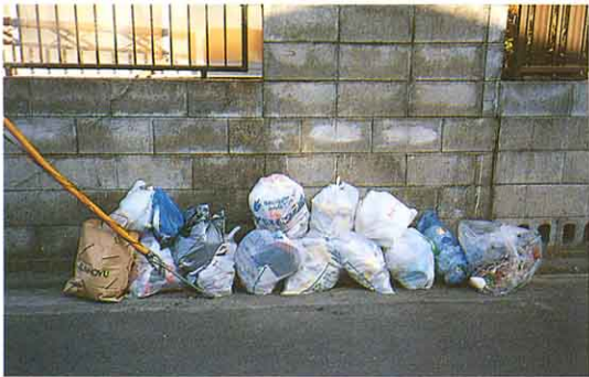
ごみを集めているようす