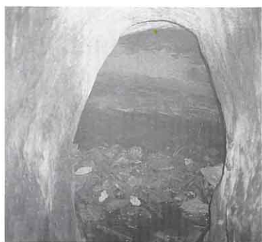
蛸沢のつつみよりの水路

公立相馬総合病院の近くにある、 えび 蛸沢のつつみにも当時のすぐれたぎじゅつがみられます。小泉川より水路を作り、一部はトンネルで蛸沢つつみ、さらに新沼のつつみまで引きました。原釜の地区まで利用できるようにしました。