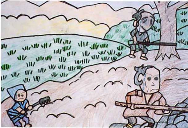
二宮尊徳についての紙しばい

人々は、すすんではたらきました。草をかいたり、木を切ったりして、荒地を切り開いたり、用水を作ったりしました。人々は、仕法の役所の教え：