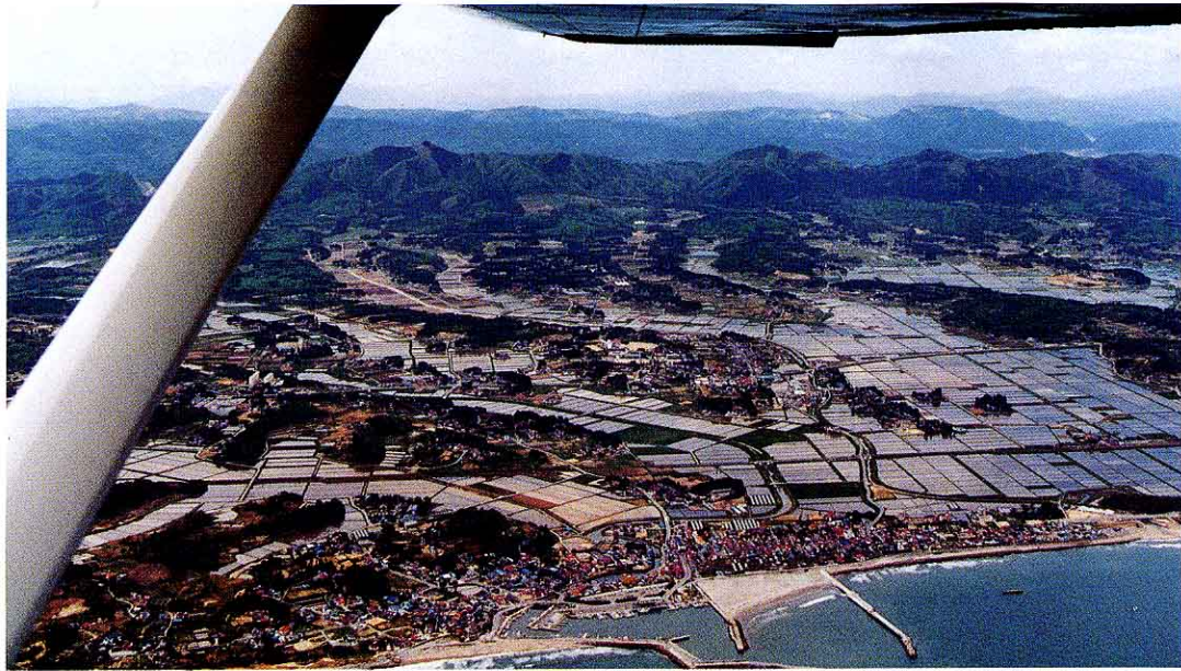
つるしまぎよこう ○空の上から見た釣師浜漁港