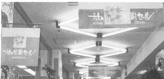
店の中のせんでんやくふう