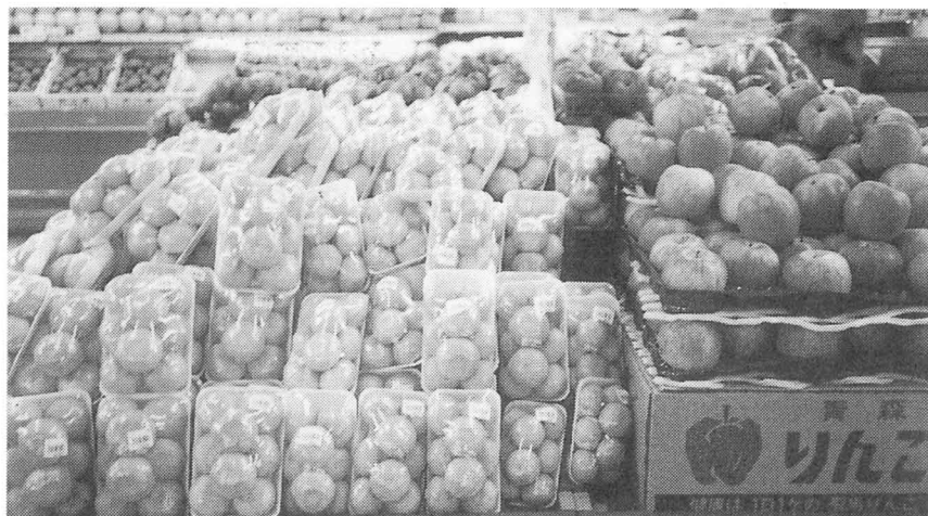
パックづめになったみかんと、ばら売りのりんご