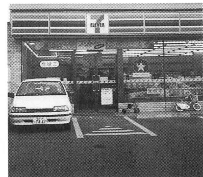
コンビニエンスストア