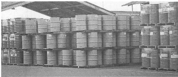
外国からはこぼれたペースト（トマトをつぶしたもの）のかん