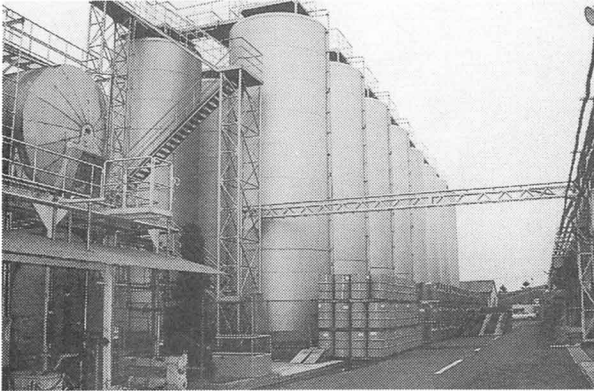
げんりょうをためておくタンク