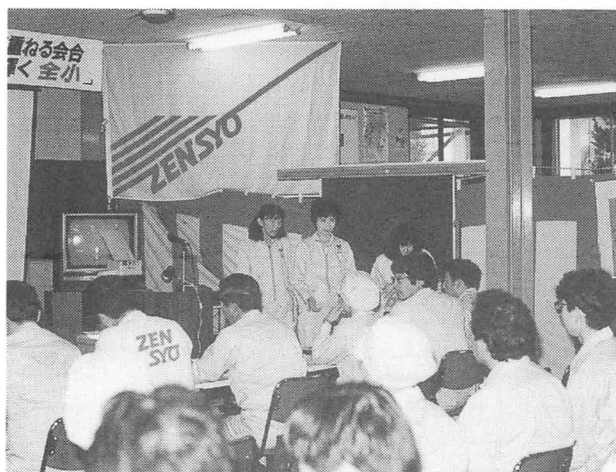
けんしゅう会 べんきょう で勉強する