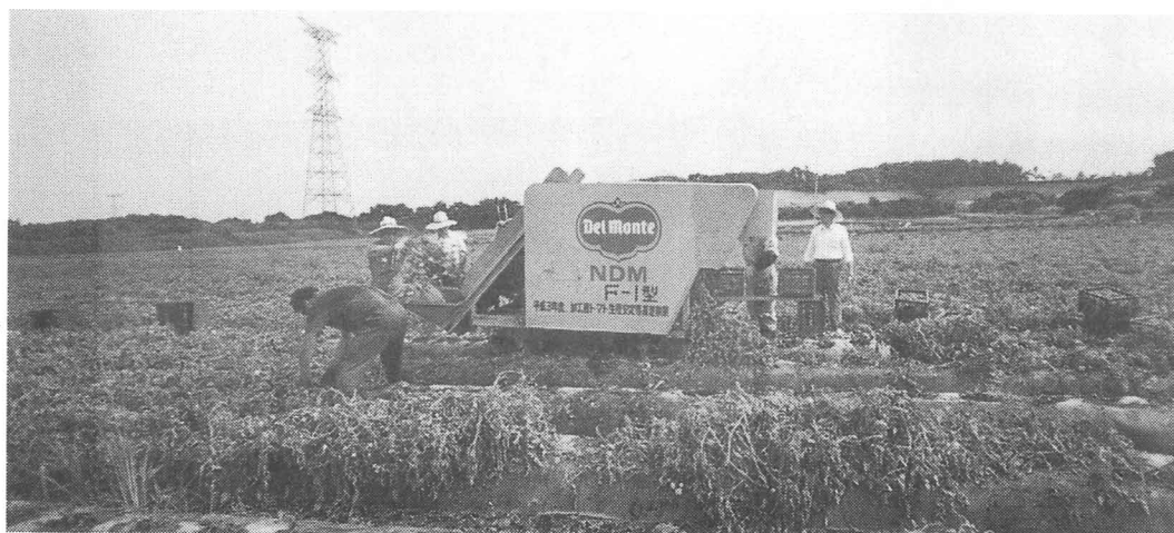
きかいによるしゅうかく（山形県）