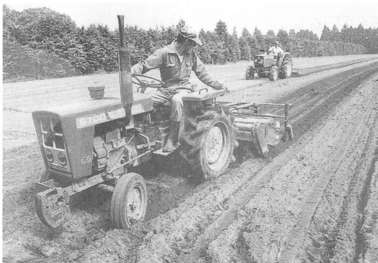
←たしかめながら、たねをまく。