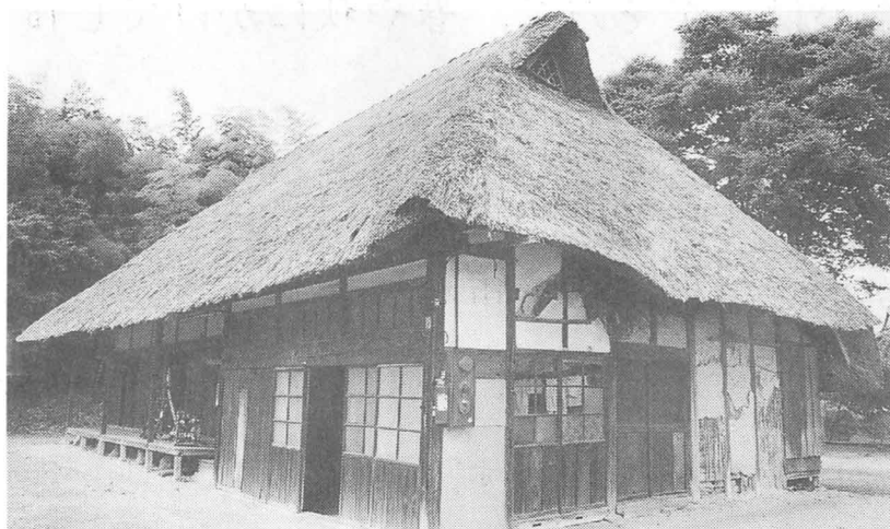
武山家住宅のようす