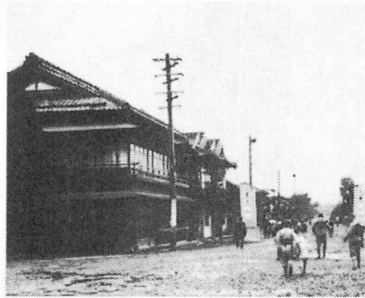
むかしの駅前（1940年ごろ）