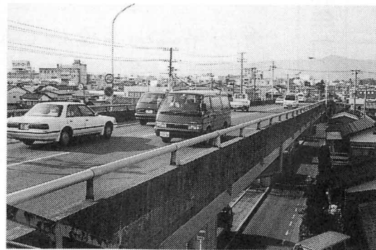
鉄道をまたぐ立体橋