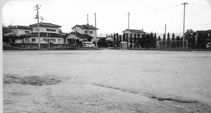
中部町民運動場 関場三丁目27