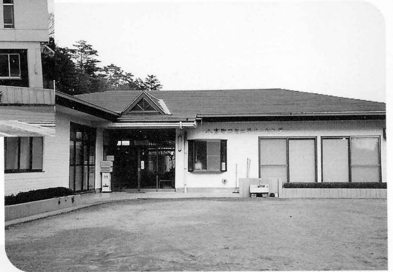
▲ コミュニティセンター 蛭沢字藤沼50 ☎44-3221