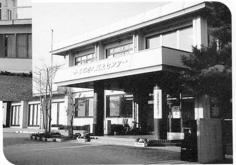
老人福祉センター(保健衛生センター) ▶ 東町三丁目22 ☎44-6407