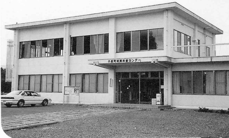
▲ 就業改善センター 飯崎字北原125 ☎44-3215