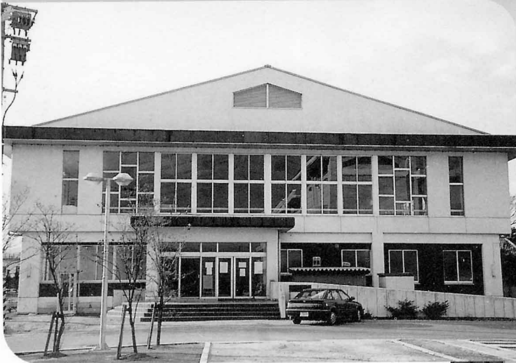
▲ 小高勤労者体育センター 関場一丁目77 ☎44-6092