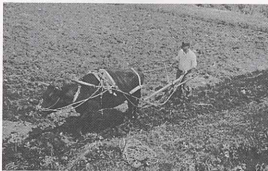
牛でたがやしている