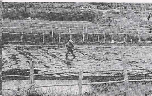
しろ田のすじ引き