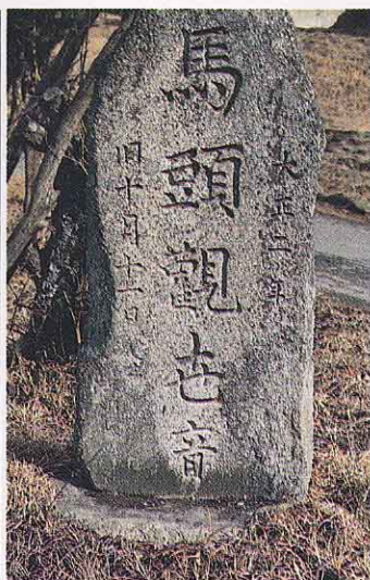
すがた 菅田のばとうかんのん