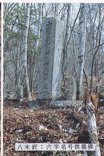
八木沢：六字名号供養碑