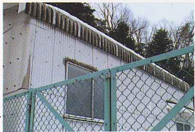
おおくらじょうすいじょう 大倉浄水場