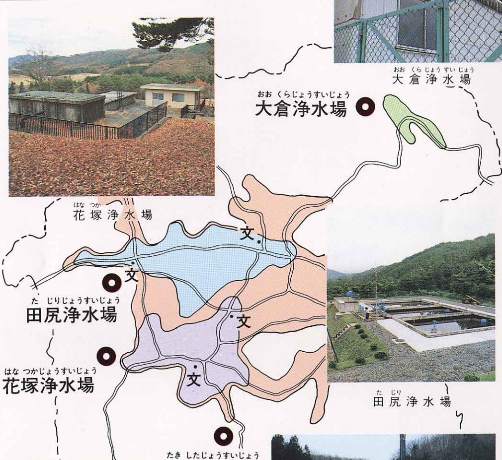
おおくらじょうすいじょう 大倉浄水場