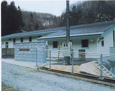
たきしたじょうすいじょう 滝下浄水場