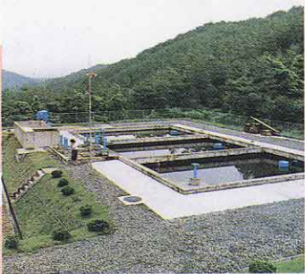
たじり 田尻浄水場