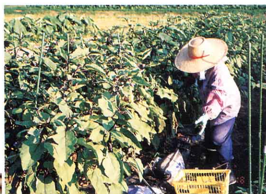
<野菜（やさい）づくり>