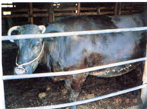
<肉牛（にくぎゅう）のしいく>