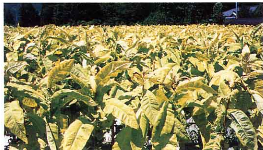
< 畑の葉たばこ >