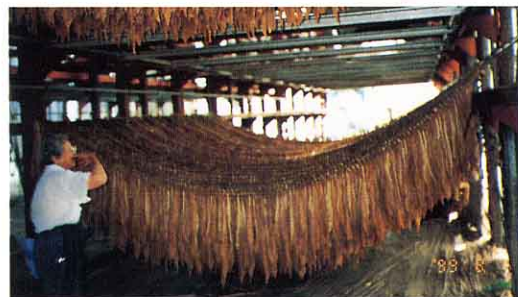
< 収穫し、乾燥させている葉たばこ >