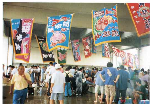
<ひらめまつりのようす>