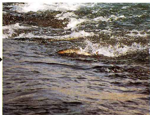
〈さけが川をのぼってくる〉