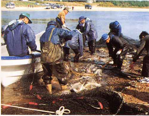
〈さけをつかまえる〉