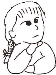
<ゴミの出し方を知らせるポスター>