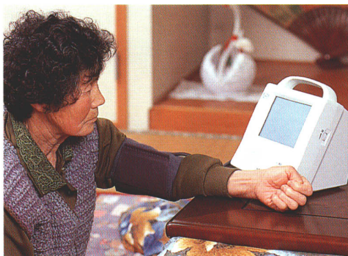
血圧測定をしている様子

全世帯に“在宅健康監視装置”を設置し、各家庭で血圧・心電図等をはかりデータを毎日保健婦がチェック。また、これは緊急通報にも利用でき、健康管理体制が、さらに充実しました。