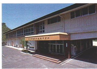
健康増進センター

全世帯に“在宅健康監視装置”を設置し、各家庭で血圧・心電図等をはかりデータを毎日保健婦がチェック。また、これは緊急通報にも利用でき、健康管理体制が、さらに充実しました。