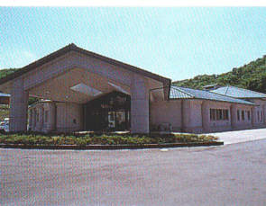
総合福祉センターみどり荘