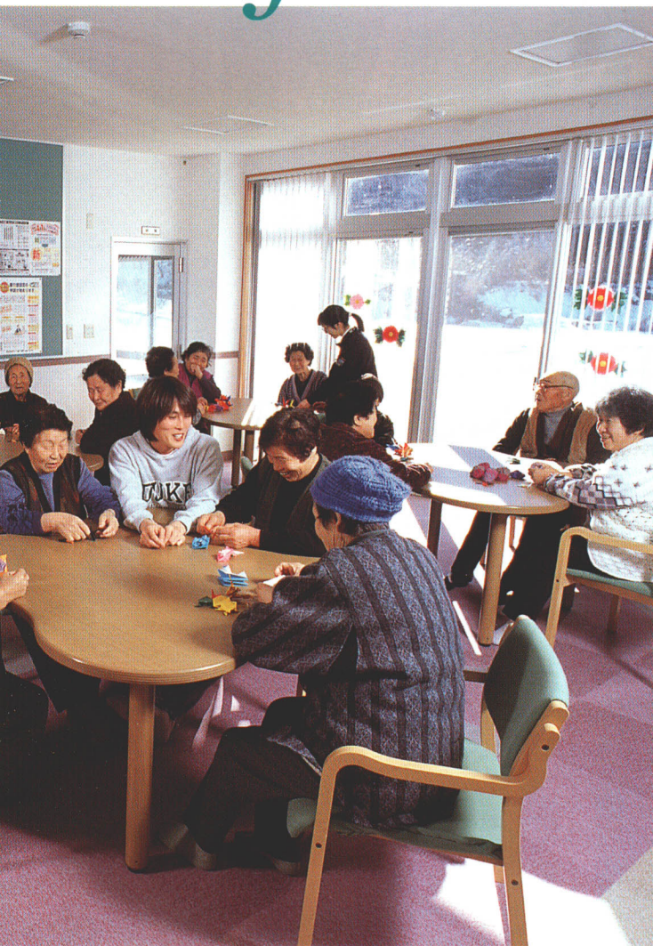
デイサービスセンター