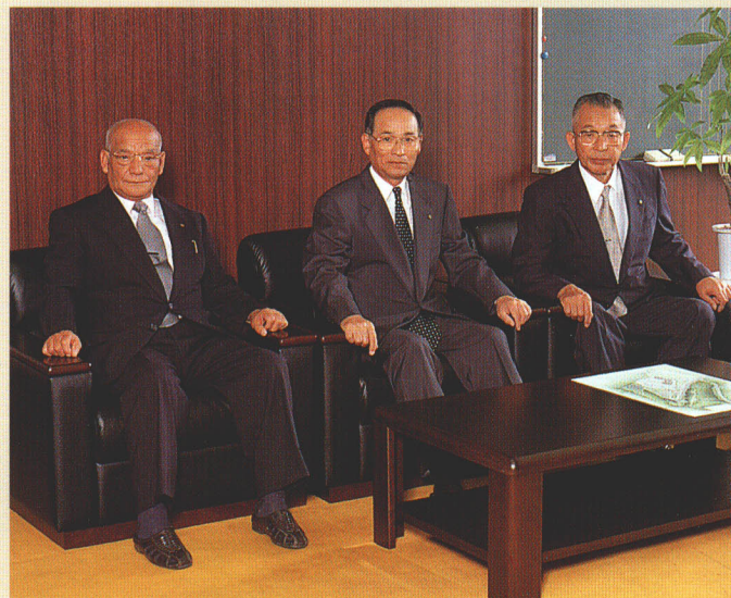
右から、村長・助役・収入役・教育長