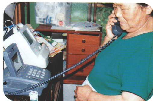
遠隔診療の様子（患者側）