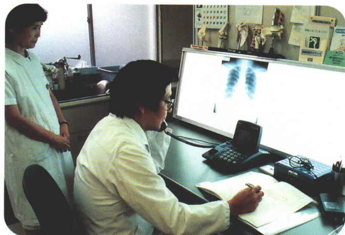
遠隔診療の様子（医師側）