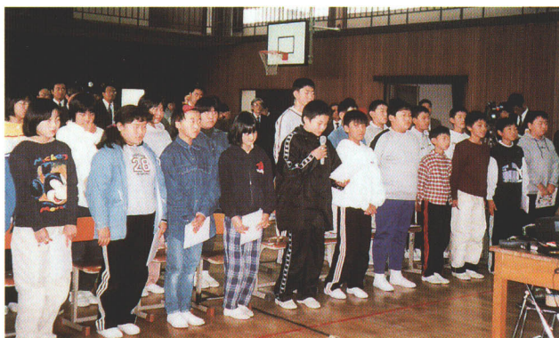
授業を受ける葛尾小学校の児童

テレビ電話を利用して、被爆体験者の話を実際に聞き、戦争の悲惨さや原爆の恐ろしさを実感し、平和への思いをより高めることができました。また東北の学校9校と、父兄宅13ヶ所、ソフトウェアビジョンによるインターネット中継も行いました。