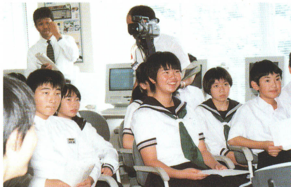
授業を楽しむ葛尾中学校の生徒

葛尾中学校では、テレビ電話を利用して、外国人講師による遠隔英会話授業を実施しています。活きた英語に直接触れることにより、普段の授業では得られない国際的な雰囲気の中で授業が進められています。