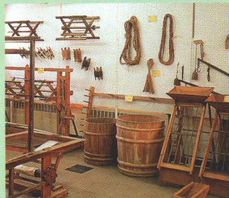
⑤郷土文化保存伝習館