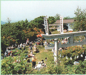
①日山(天王山) 1057.6mでの山開き