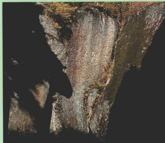
③磨崖仏(大尽屋敷跡)