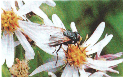
ヨメナとハナバエの1種

路傍のヨメナやシオン類は最盛期で、モンキチョウやキチョウ、ハナアブなどが飛びかっている。鳴く虫も多く、エンマコオロギの