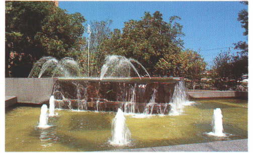
▲役場庁舎前の噴水