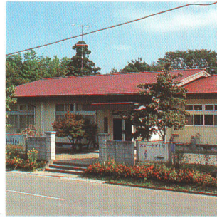
▲北部コミュニティセンター