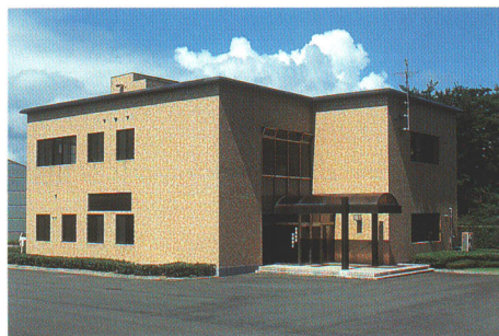
▲双葉町浄化センター