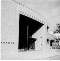
ふたばまちとしょかん 双葉町図書館

わたしたちの町には町民が利用できる図書館があります。図書館は、1984年7月に開館し、10年間で約39万3千人が利用しました。貸し出された本は、約51万さつになります。