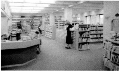
ほんだなとカウンター