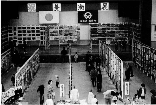
び じゅつ てん 展 美術展

ふたば ちょうみん のための たいいく しせつ として つくられました。バレーボールやバドミントンなど たの しょうす み おお ひとびと りよう を楽しんでいる様子が見られ、多くの人々に利用されています。