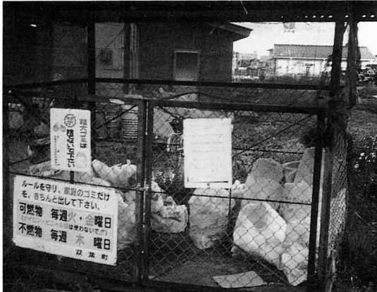
しゅうしゅうばしょ ごみ収集場所

ごみを出す日には、たくさんのごみが集まります。収集場所はよごれやすいので、みんなの協力が必要です。