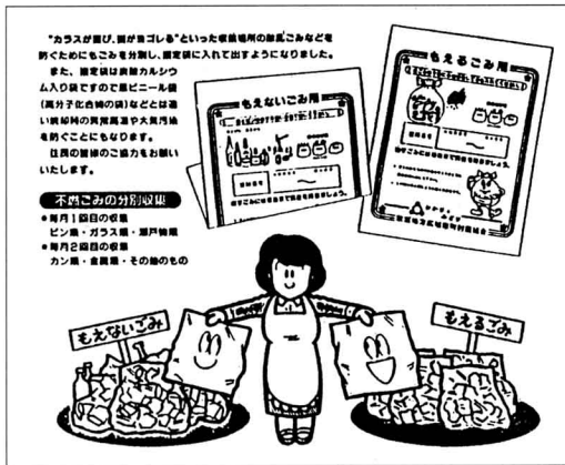
ぶんべつしゅうしゅう 分別収集のちらし