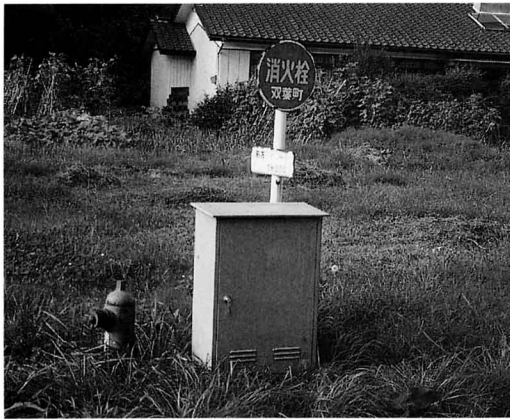
消 火 栓 (256 か所)