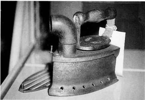
ア イ ロ ン