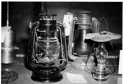
ラ ン プ

じ ぶ ん い え 自 分 の 家 に あ る 古 い 道 具 に つ い て 、 ど の よ う に つ か っ て い た の か 調 べ て み ま し ょ う 。