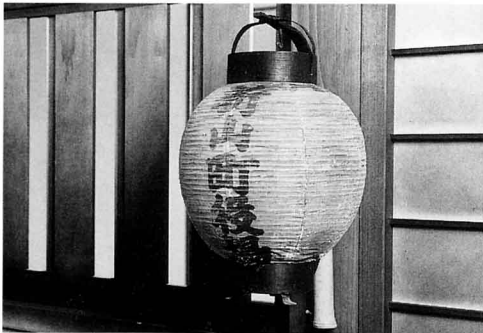
ち ょう ち ん

ふる とうぐ 古い道具をつかって、ひと 人びとはどのようにくらしをしていたのでしょうか。