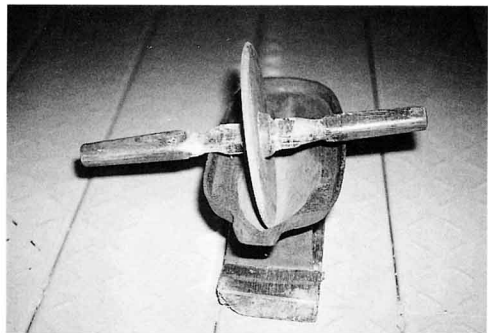
や げ ん