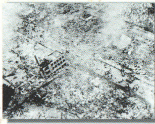
昭和30年 新潟市大火