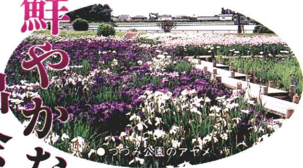
●つつみ公園のアヤメ