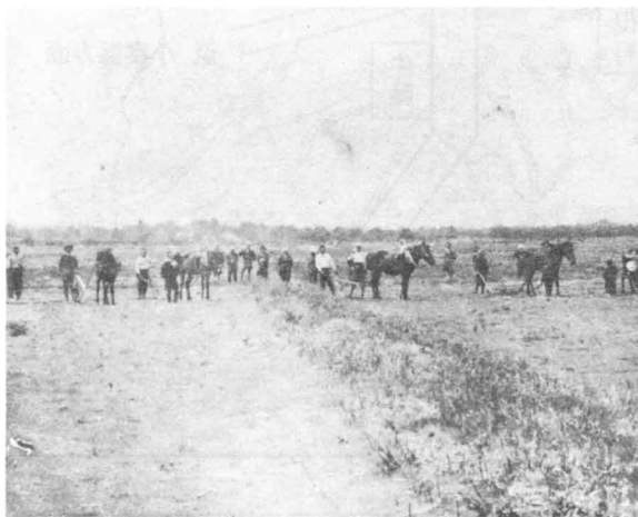
中学校のある新町辺