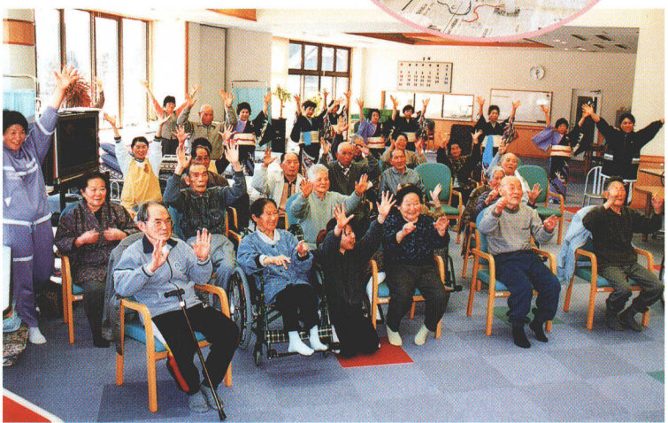
日常生活動作訓練室